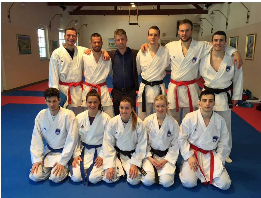
Udeleženci EP v Franciji v športnih borbah skupaj z Podžupanom občine Brežice na zaključnih pripravah na Čatežu ob Savi