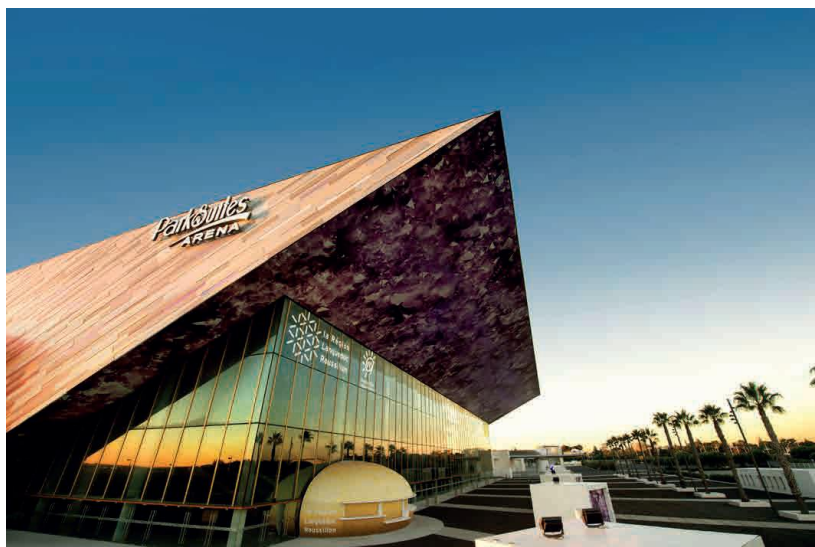
ARENA DE MONTPELLIER – Prizorišče članskega EP