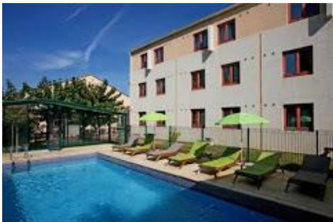
KYRIAD MONTPELLIER AEROPORT HOTEL